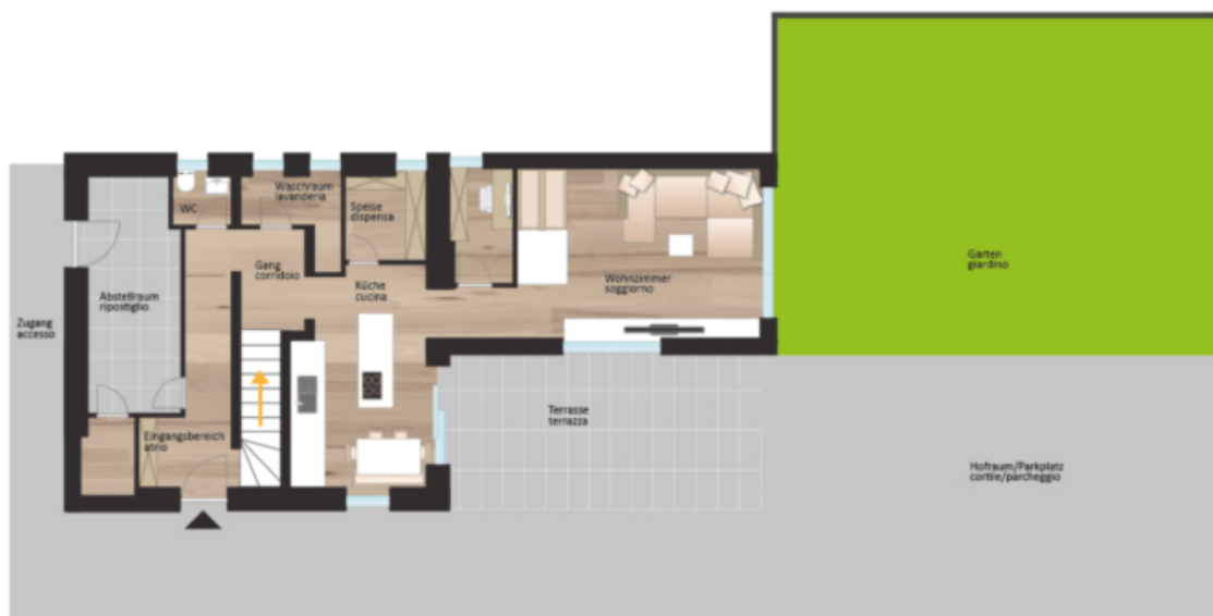
Erdgeschoss piano terra