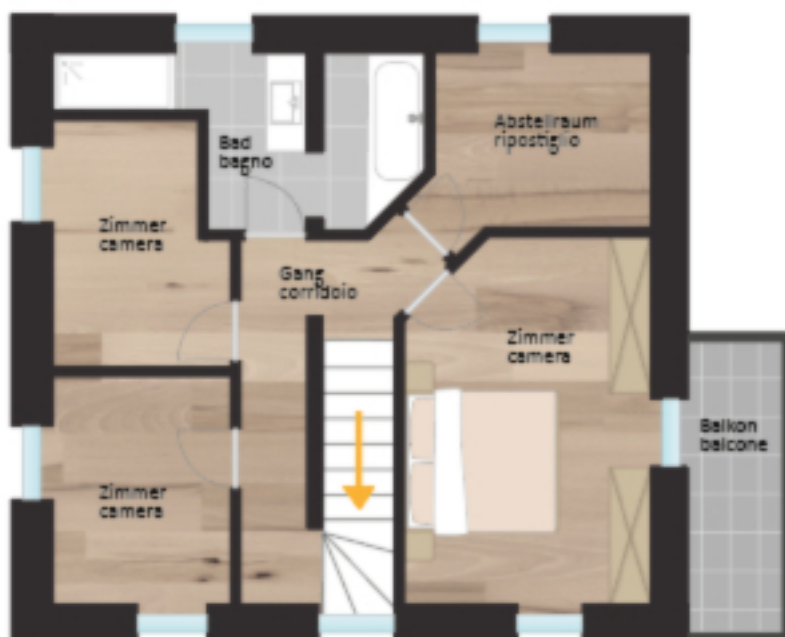
1. Obergeschoss primo piano