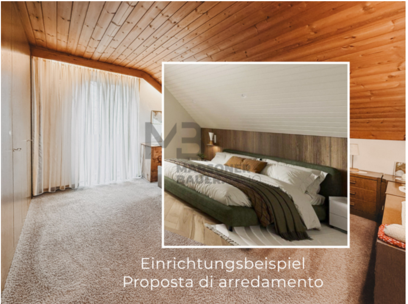
Einrichtungsbeispiel Proposta di arredamento