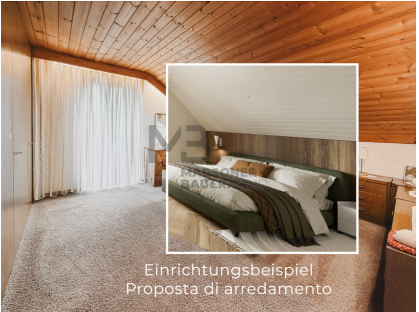
Einrichtungsbeispiel Proposta di arredamento