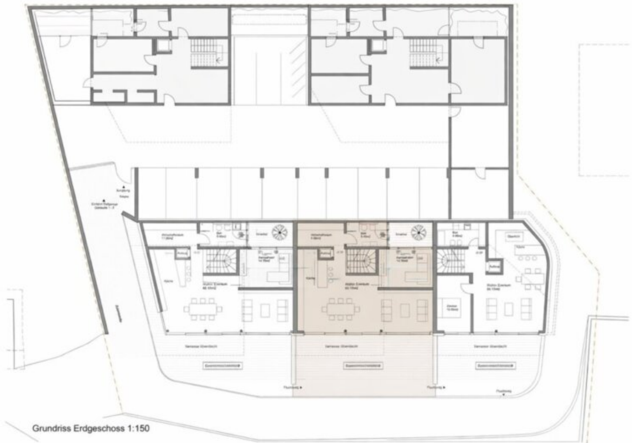
Grundriss Edgeschoss 1:150