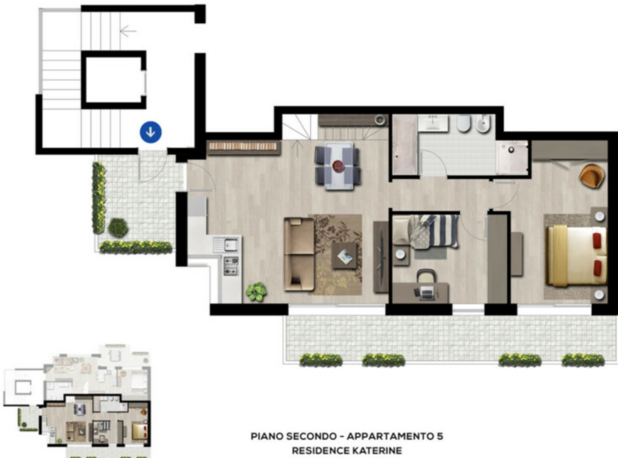
PIANO SECONDO - APPARTAMENTO 5 RESIDENCE KATERINE