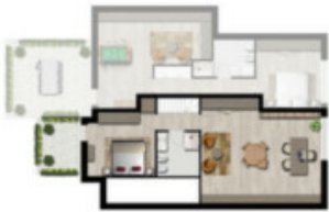
PIANO SOTTOTETTO - APPARTAMENTO 5 RESIDENCE KATERINE