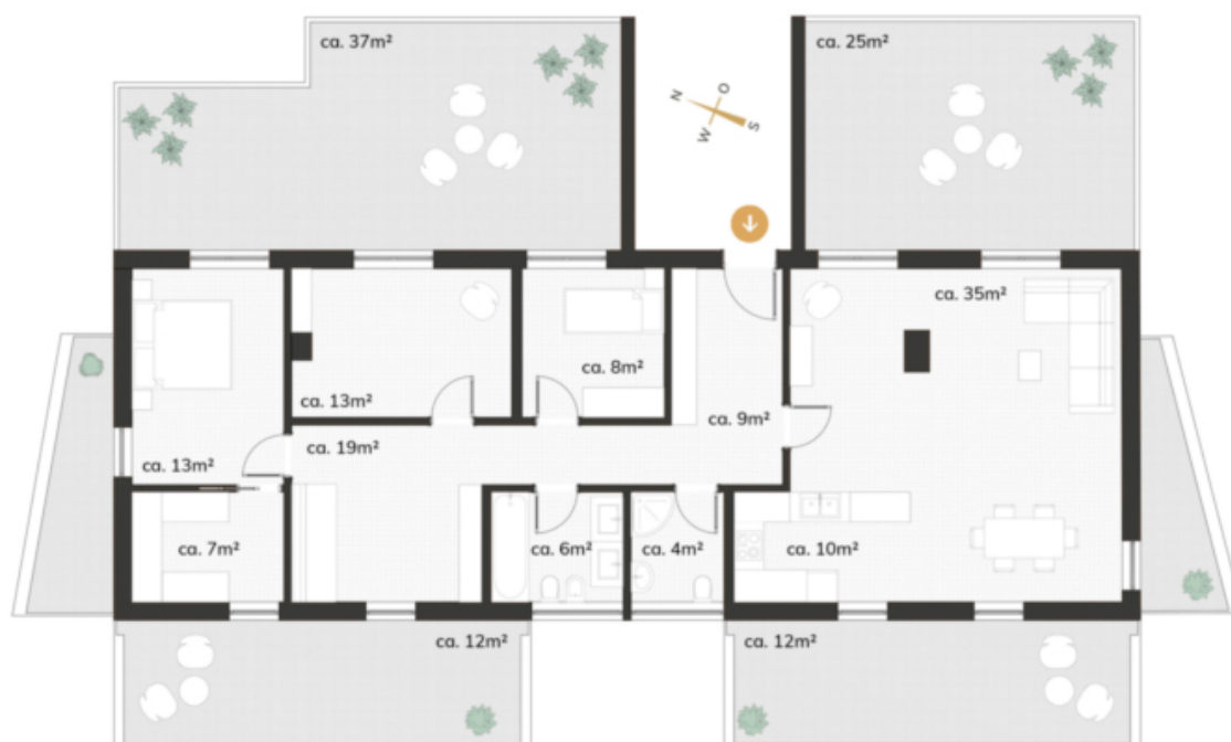
Dachgeschoss | Attico

Pläne folgend keinen Maßstab sofern nicht explizit angegeben. Alle Angaben ohne Gewähr. Änderungen vorbehalten. I piani non seguono scale se non specificatamente indicato. Tutte le dichiarazioni senza garanzia. Soggetto a modifiche.