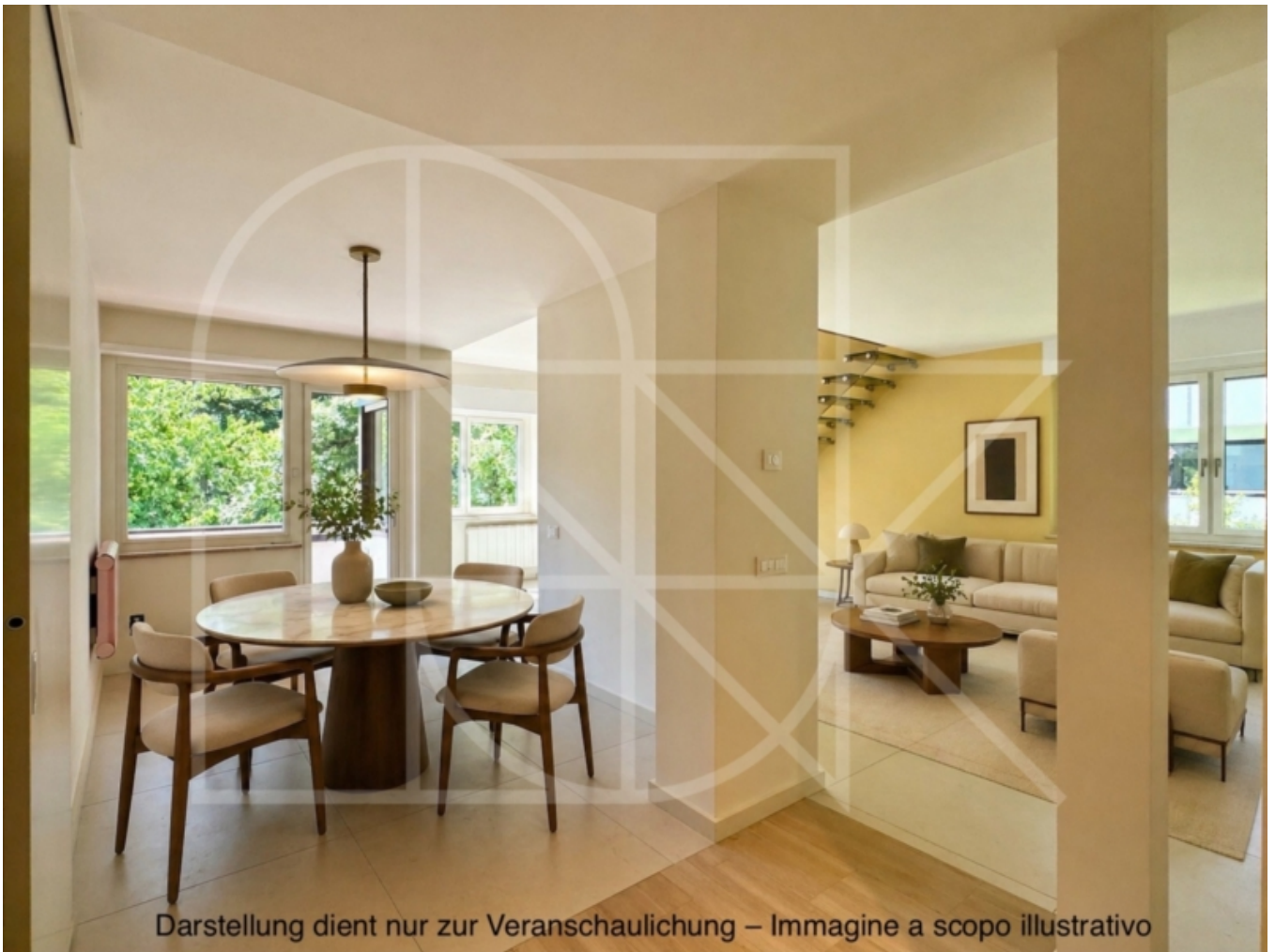
Darstellung dient nur zur Veranschaulichung – Immagine a scopo illustrativo