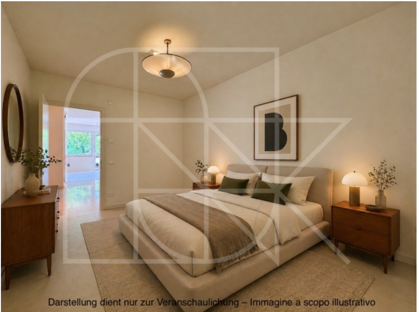
Darstellung dient nur zur Veranschaulichung – Immagine a scopo illustrativo