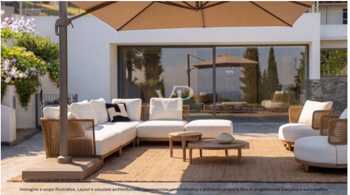
Immagine a scopo illustrativo. Layout e soluzioni architettoniche rappresentate sono indicative e potranno variare in fase di progettazione esecutiva e autorizzativa.