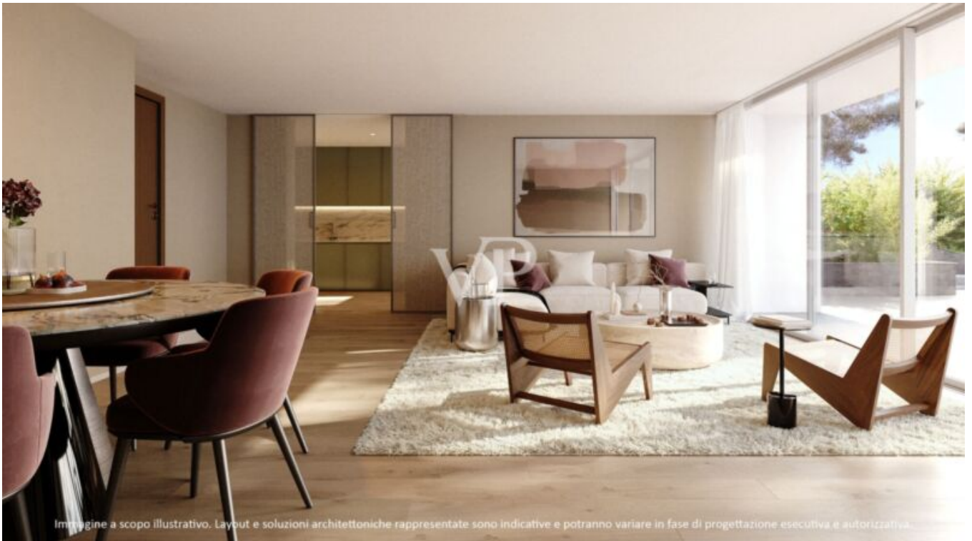
Immagine a scopo illustrativo. Layout e soluzioni architettoniche rappresentate sono indicative e potranno variare in fase di progettazione esecutiva e autorizzativa.