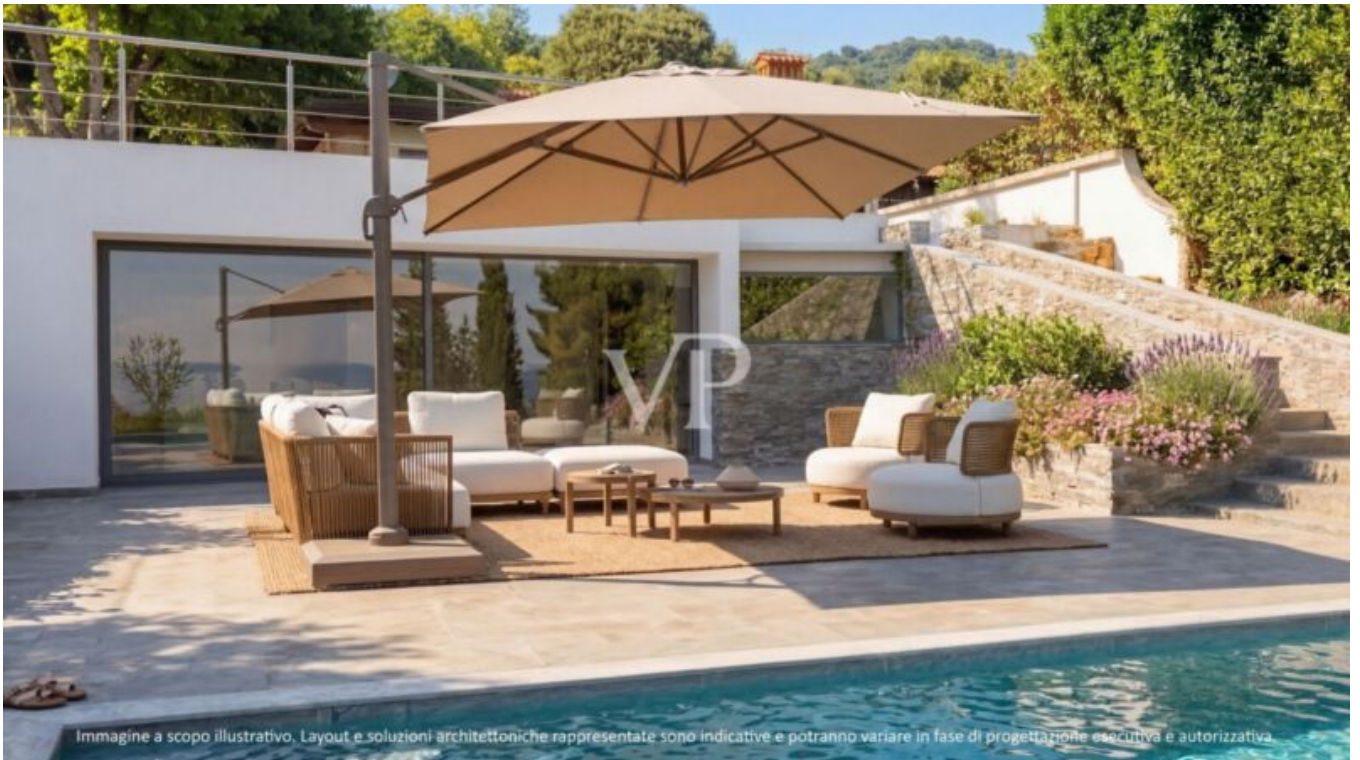
Immagine a scopo illustrativo. Layout e soluzioni architettoniche rappresentate sono indicative e potranno variare in fase di progettazione esecutiva e autorizzativa.