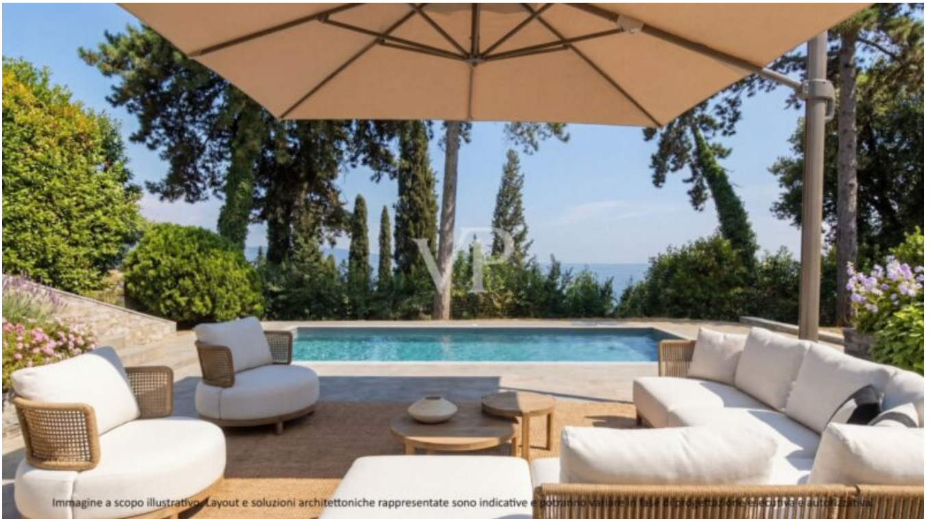
Immagine a scopo illustrativo. Layout e soluzioni architettoniche rappresentate sono indicative e potranno variare in fase di progettazione esecutiva e autorizzativa.