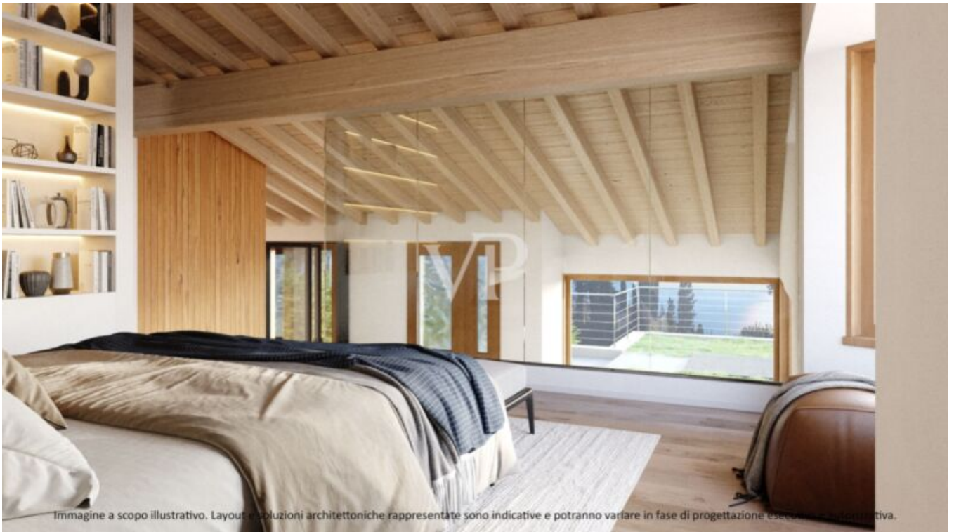
Immagine a scopo illustrativo. Layout e soluzioni architettoniche rappresentate sono indicative e potranno variare in fase di progettazione esecutiva.