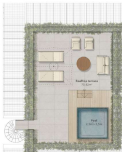
M1 - Olivo 76,00 m 2 zona giorno 31,83 m 2 terrazza 70,82 m 2 terrazza sul tetto