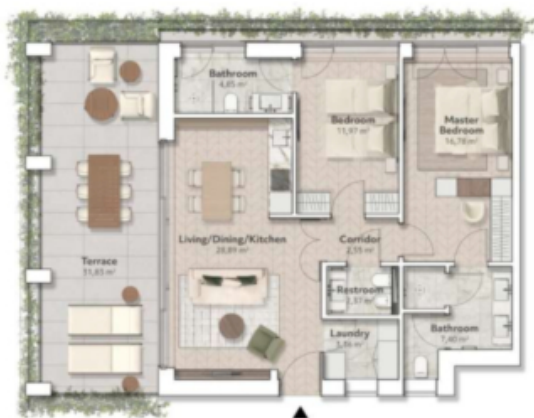
M1 - Olivo 76,00 m² zona giorno 31,83 m² terrazza