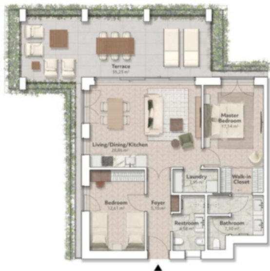
M2 - Mirto 76,00 m² zona giorno 35,23 m² terrazza