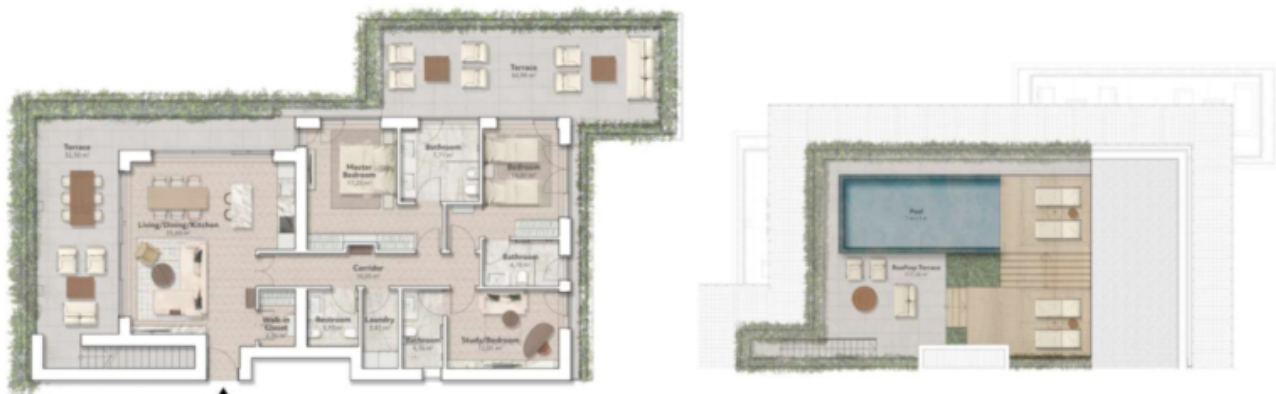
L2 - Cedro 115,36 m 2 zona giorno 77,12 m 2 terrazza 117,26 m 2 terrazza sul tetto