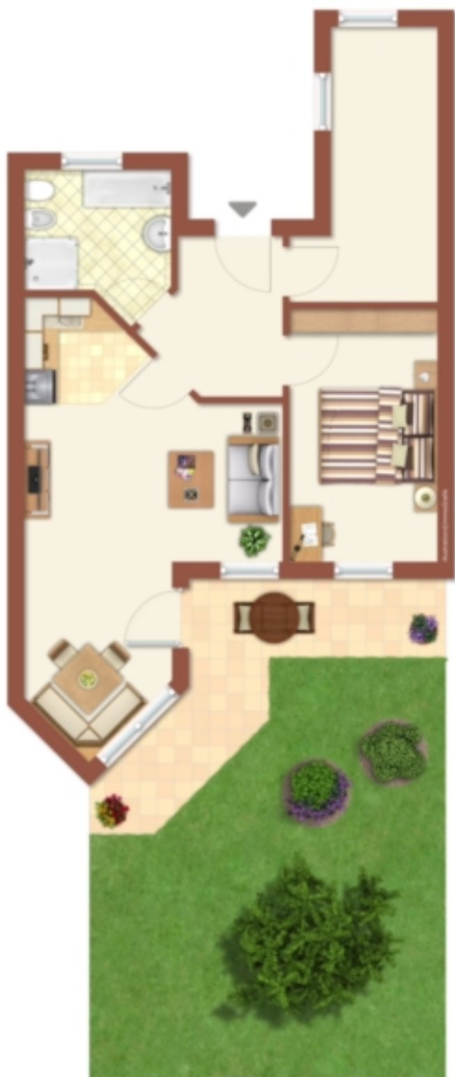
Esposizioni, non realistico