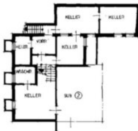
1° UNTERGESCHOSS H. 2.60 m