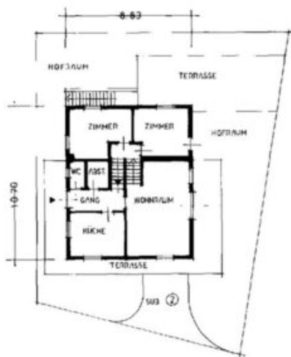
ERDGESCHOSS H. 2.60m