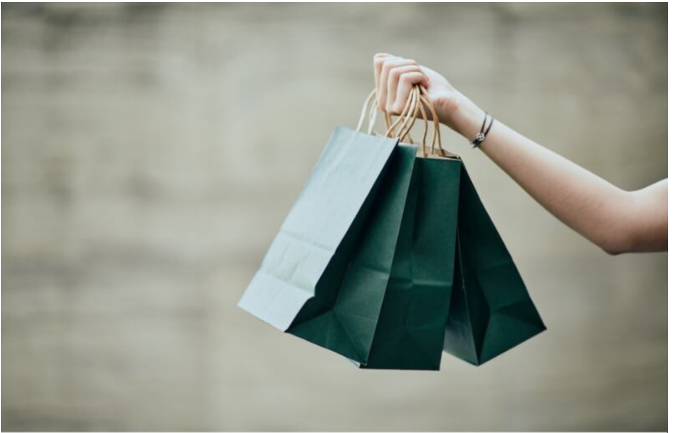
Foto dient nur zur Veranschaulichung - Abweichungen möglich | Foto solo a scopo illustrativo - possibili variazioni