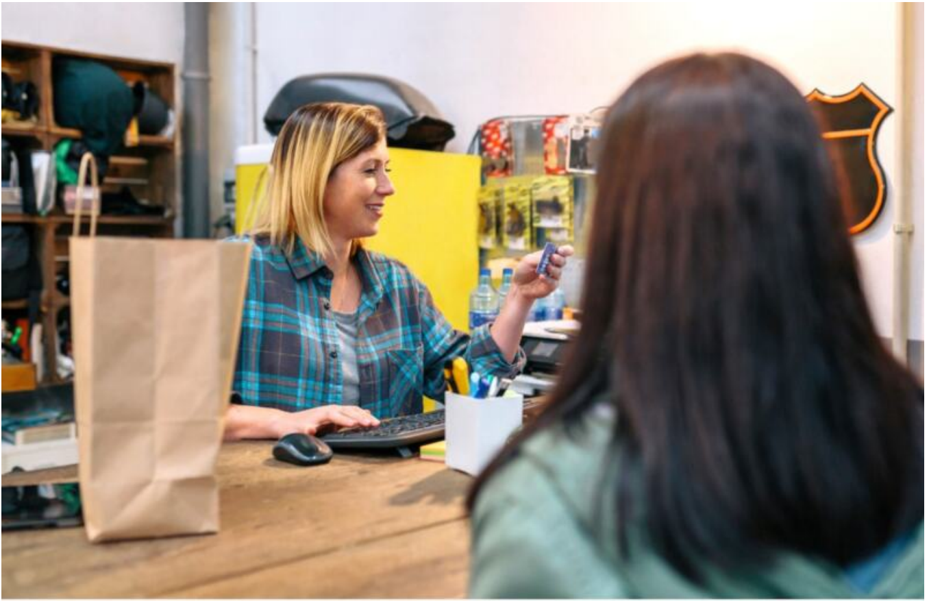
Foto dient nur zur Veranschaulichung - Abweichungen möglich | Foto solo a scopo illustrativo - possibili variazioni