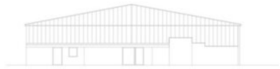
PROSPETTO OVEST - P.ED. 3489