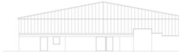
PROSPETTO OVEST - P.ED. 3489