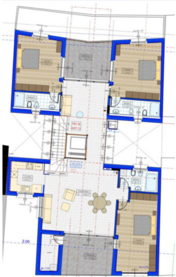
1:100 WOHNUNG 15 / APPARTAMENTO 15 - PM 16