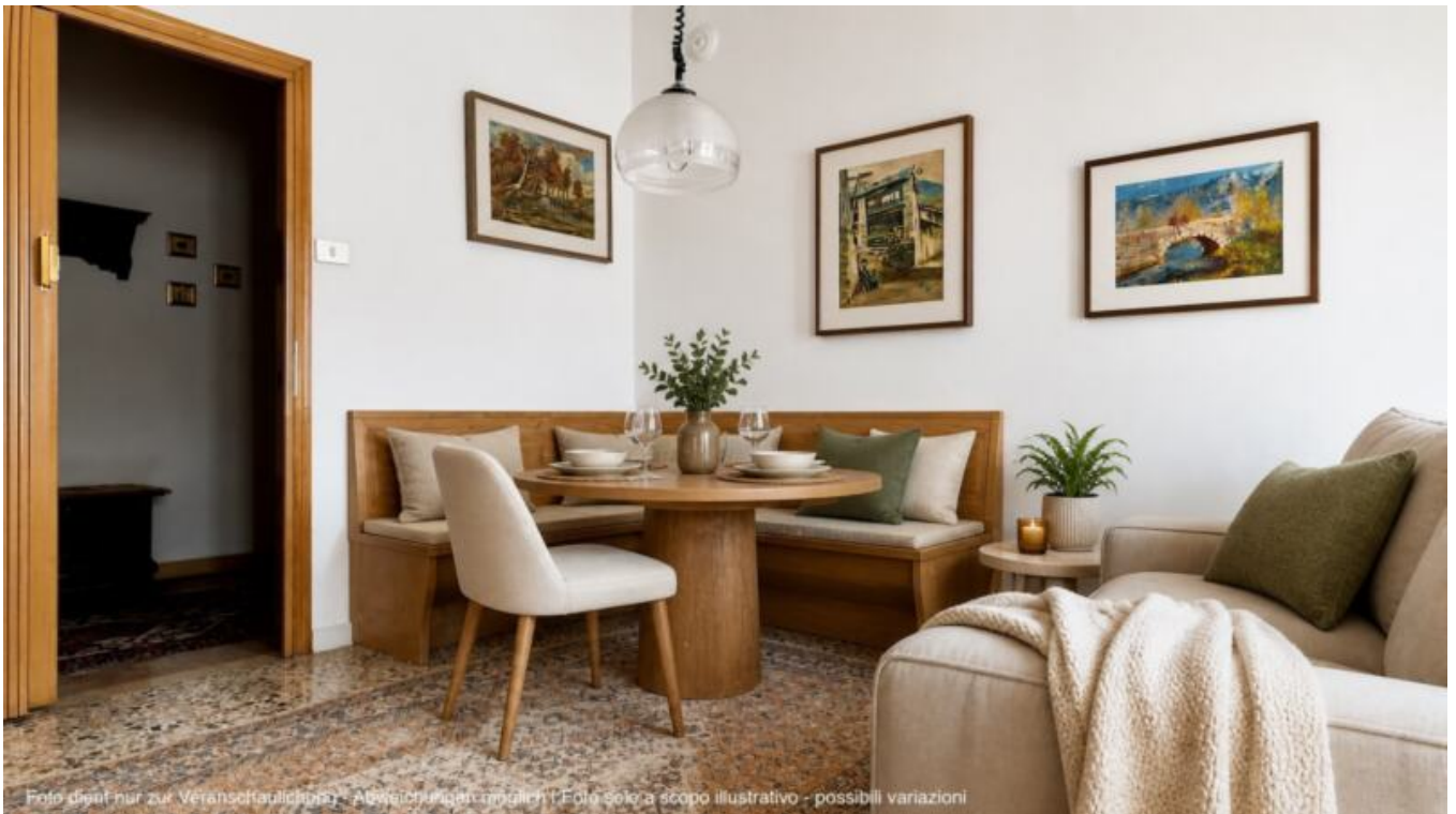
Foto dient nur zur Veranschaulichung - Abweichungen möglich | Foto solo a scopo illustrativo - possibili variazioni