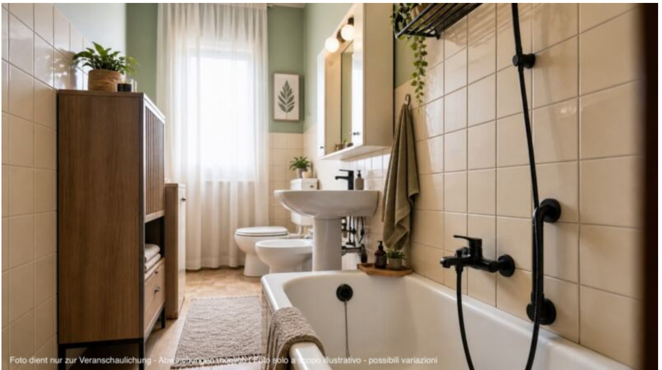
Foto dient nur zur Veranschaulichung - Abweichungen möglich | Foto solo a scopo illustrativo - possibili variazioni