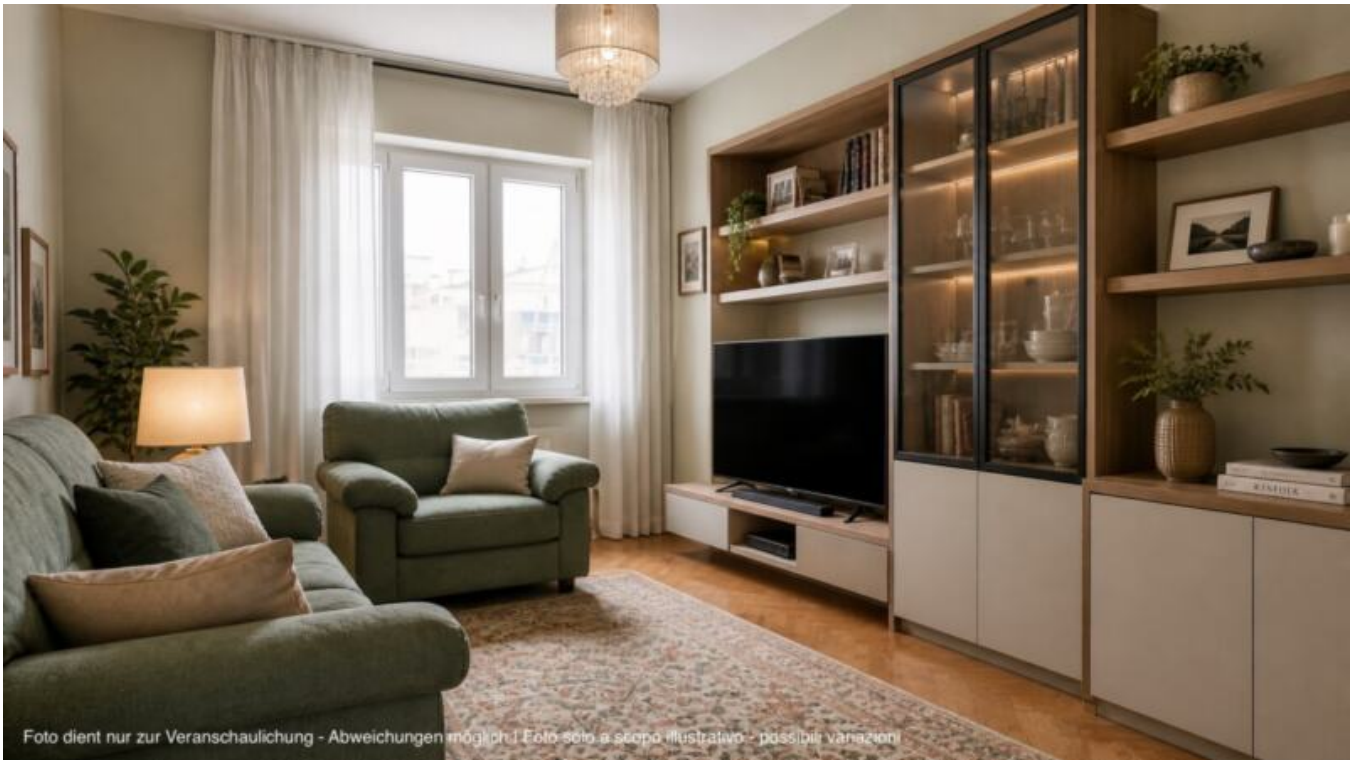
Foto dient nur zur Veranschaulichung - Abweichungen möglich! Foto solo a scopo illustrativo - possibili variazioni