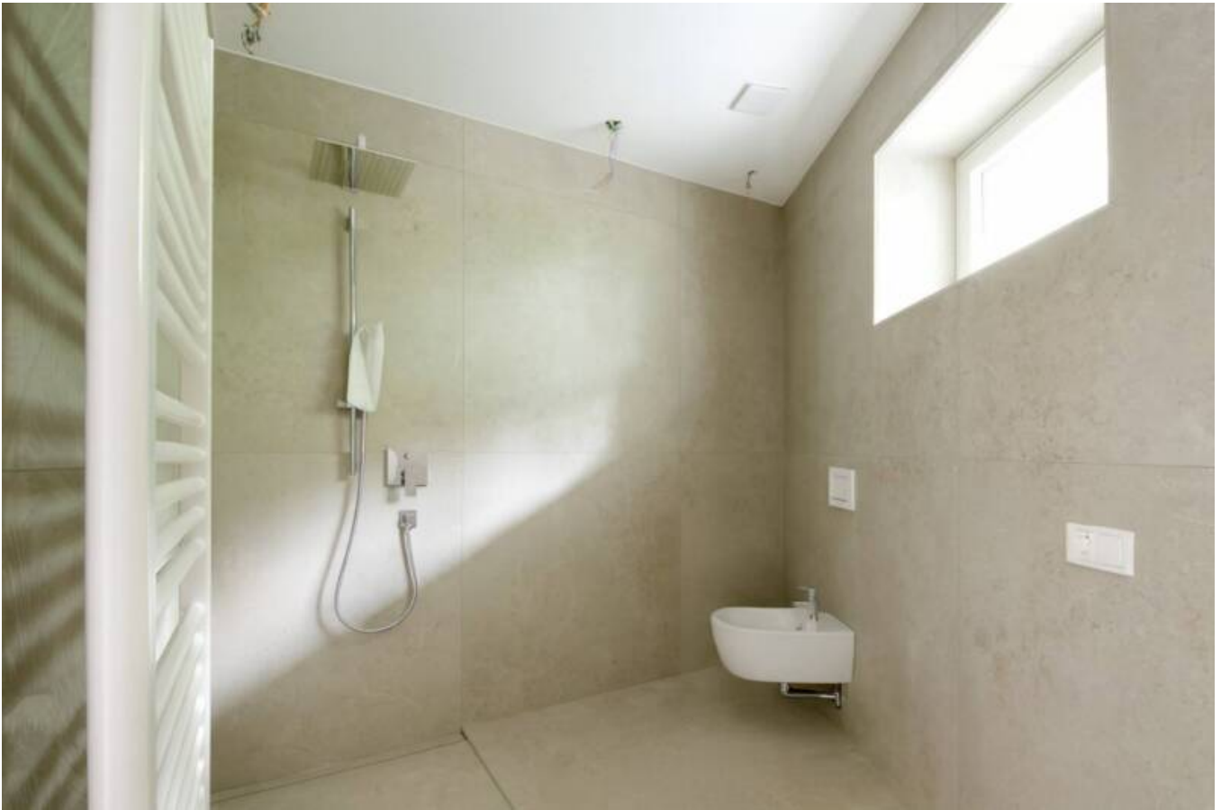
Dachgeschoss - Attico