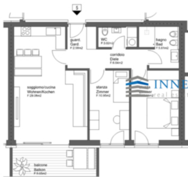
WOHNUNG 5 - APPARTAMENTO 5

FLÄCHE - SUPERFICIE: NETTO 79.42 m² BRUTTO 85.27 m² BALKON 9.65 m² BALCONE