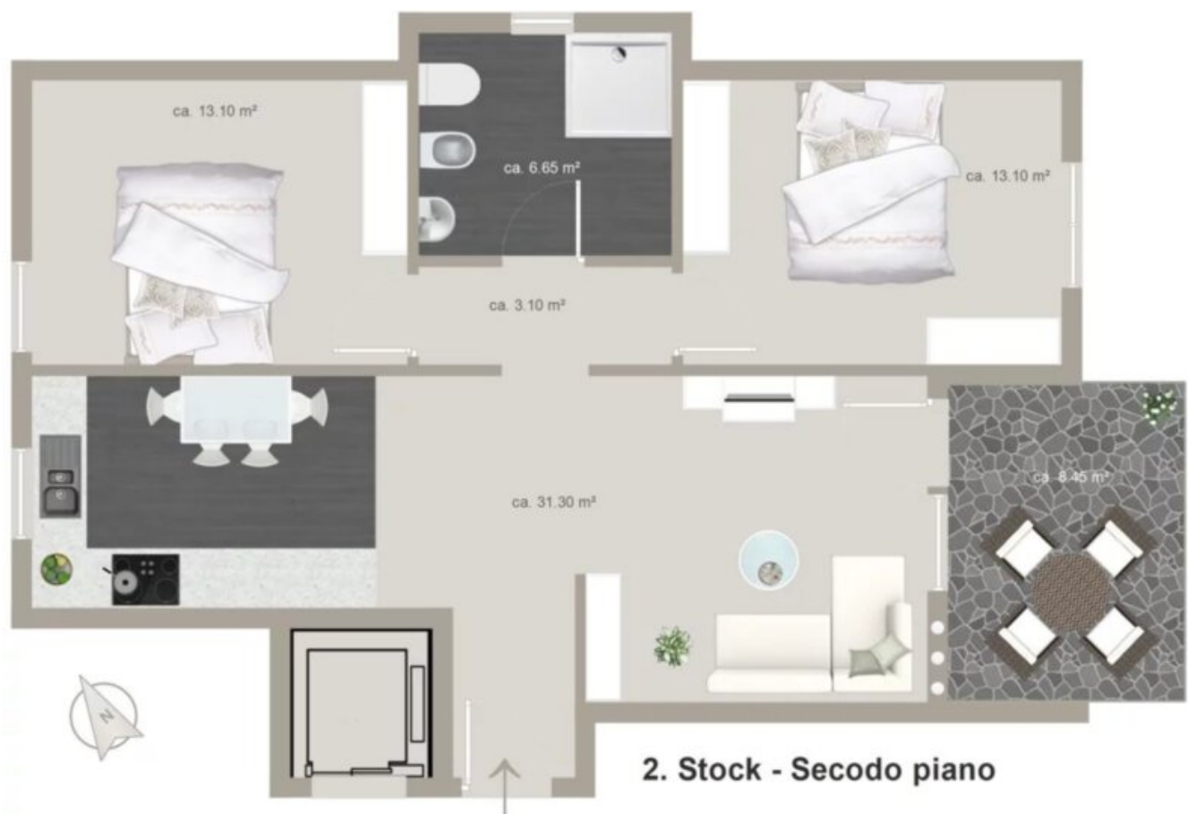
2. Stock - Secodo piano