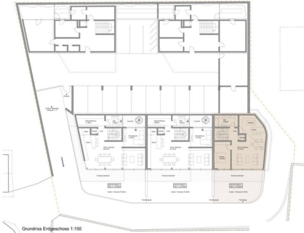
Grundriss Erdgeschoss 1:150