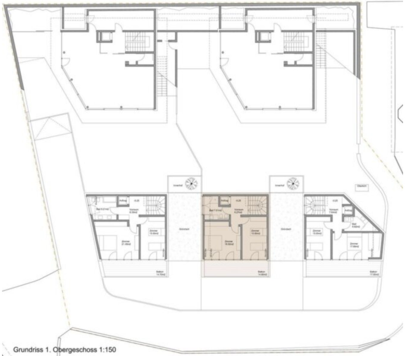
Grundriss 1. Obergeschoss 1:150