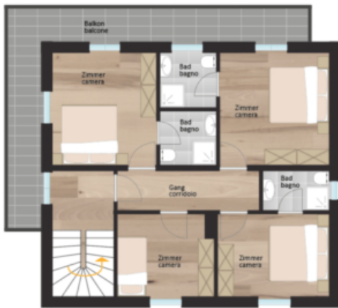
1. Obergeschoss primo piano