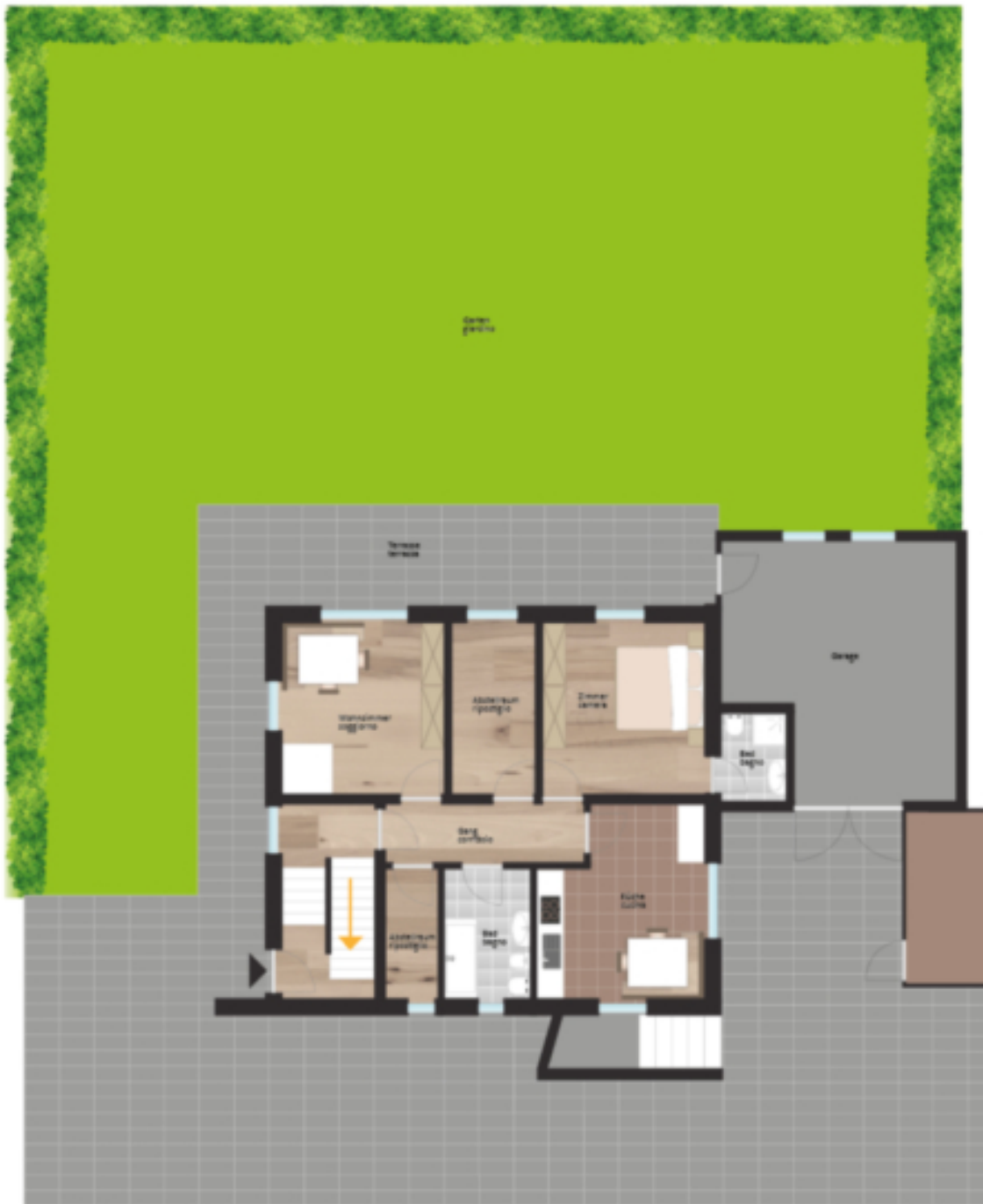
Erdgeschoss piano terra