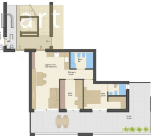
A6 Primo piano 1. Obergeschoss 1:75