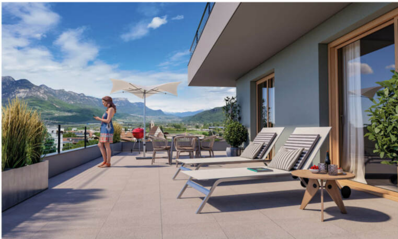
Wohnanlage Viride - Neumarkt/Egna complesso residenziale