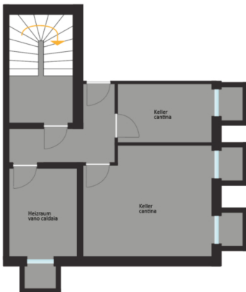
Kellergeschoss piano interrato