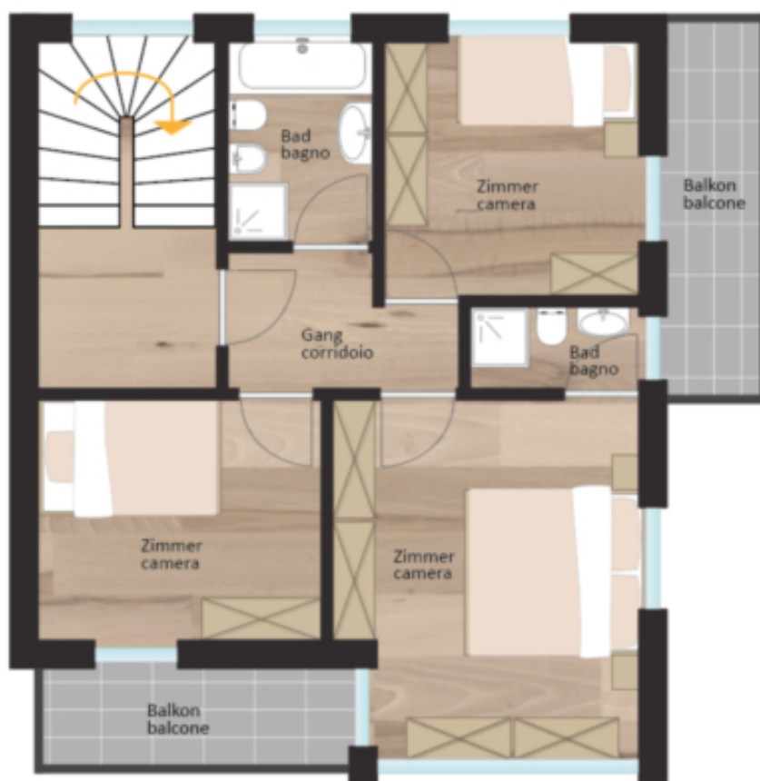
1. Obergeschoss primo piano