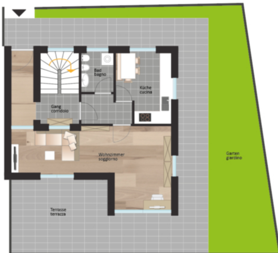
Erdgeschoss piano terra