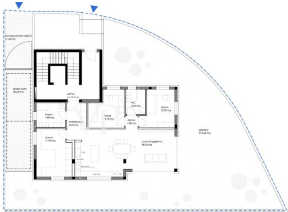
EDIFICIO B_lotto D PIANTA PIANO TERRA SCALA 1:100