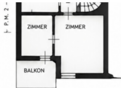
1. STOCK 1. PIANO Hm 2.20