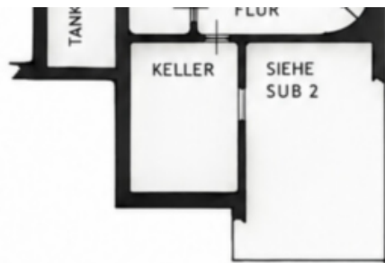
KELLERGESCHOSS SCANTINATO H2.50