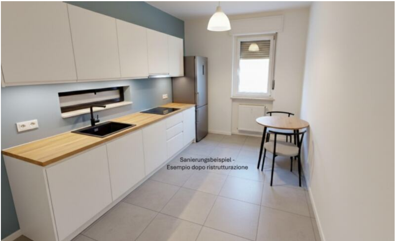
Sanierungsbeispiel - Esempio dopo ristrutturazione