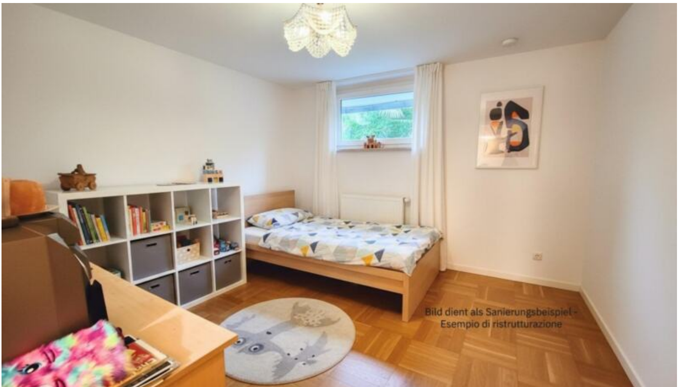
Bild dient als Sanierungsbeispiel - Esempio di ristrutturazione