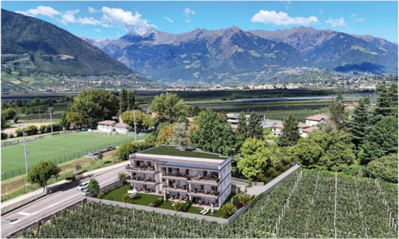
Wohnanlage Sina - Sinich-Sinigo/Meran-o complesso residenziale