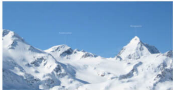
Zufallhütte (2264 m), März bis Mitte/Ende Oktober.