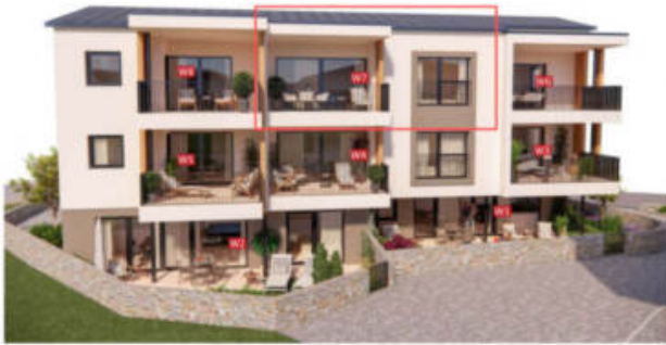
Wohnung 7 - 2.Obergeschoss + Dachgeschoss