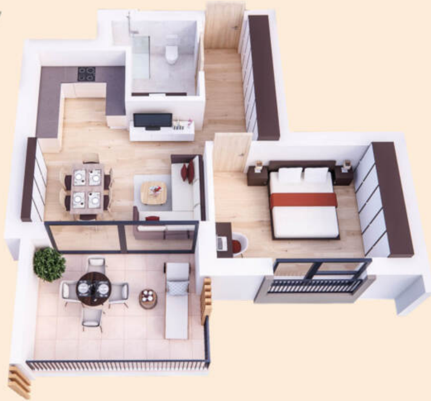
Wohnung Nr. 7