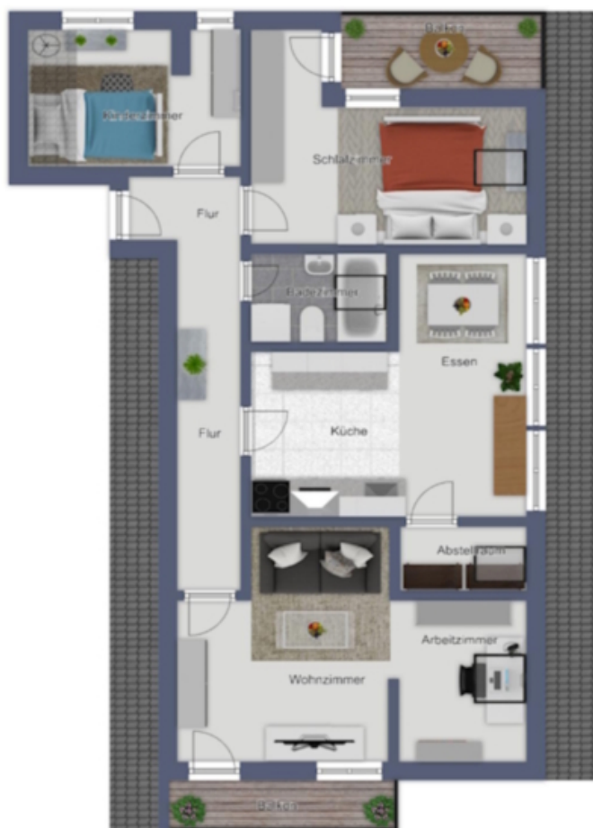
Dachgeschoss Piano Sottotetto