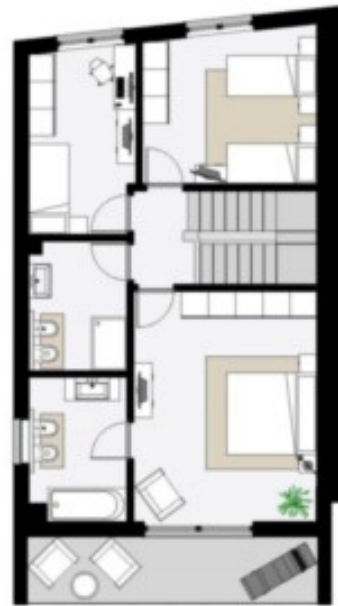
Este Obergeschoss - Piano Primo