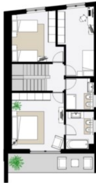
Este Obergeschoss - Piano Primo