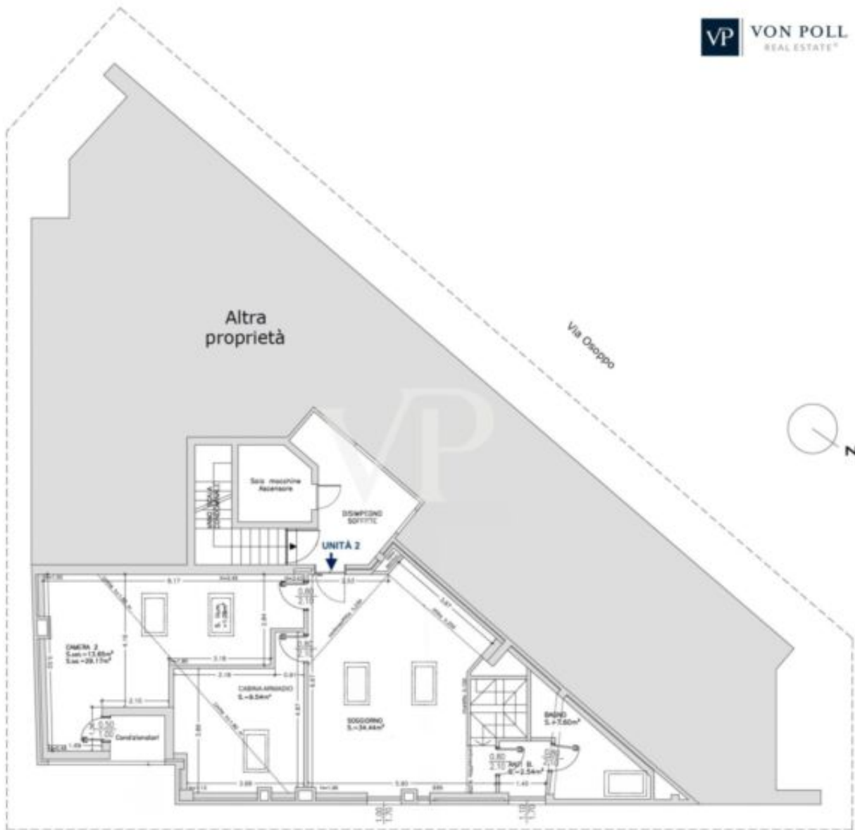
PIANTA PIANO QUINTO (SOTTOTETTO)