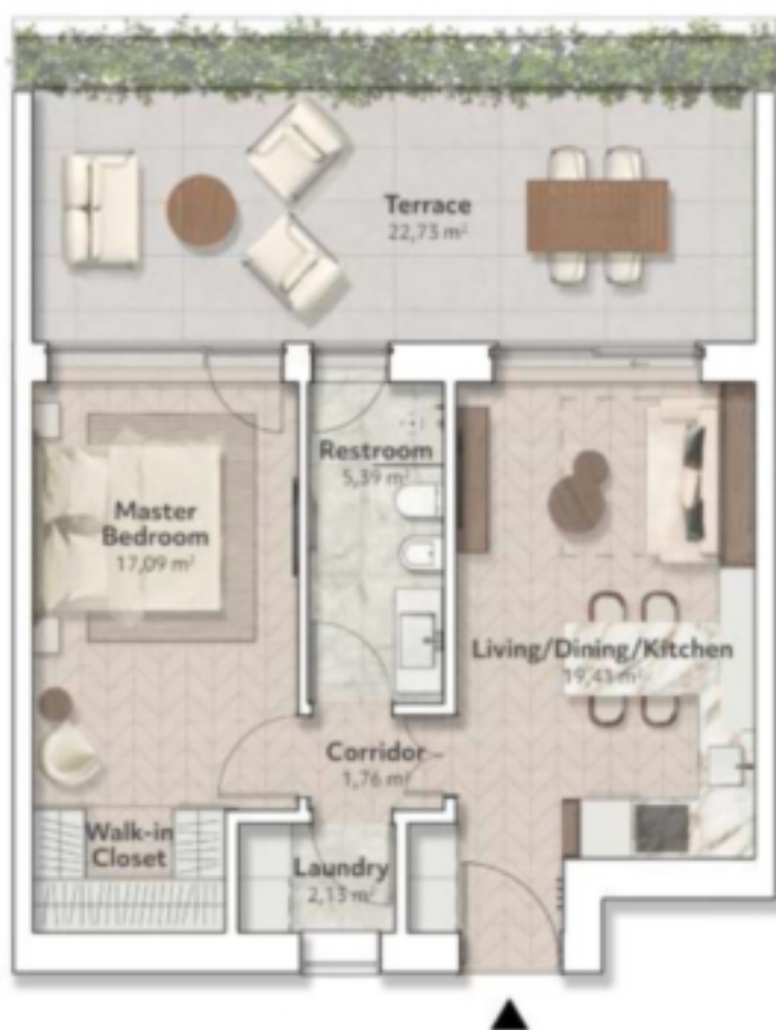
S2 - Alloro 45,59 m² zona giorno 22,73 m² terrazza