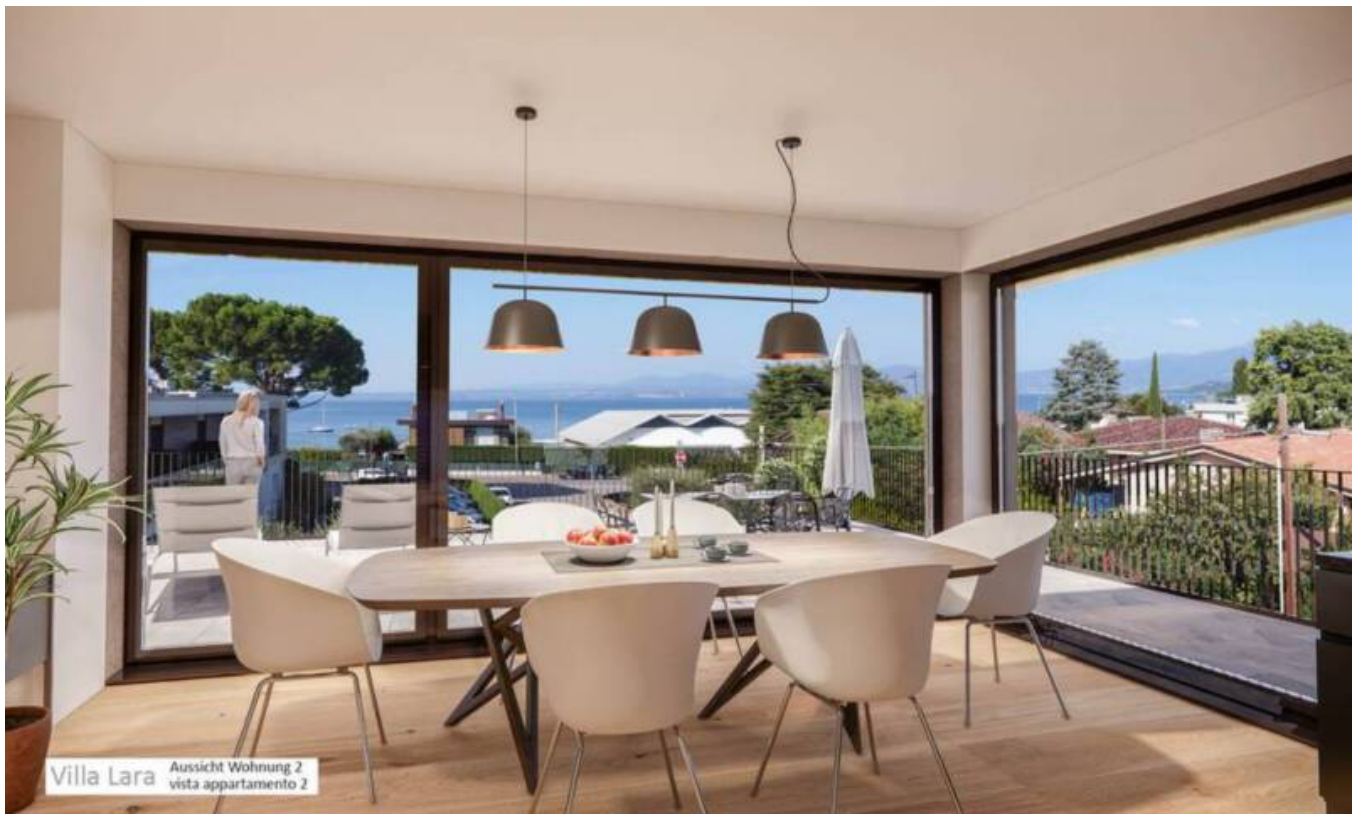
Villa Lara Aussicht Wohnung 2 vista appartamento 2