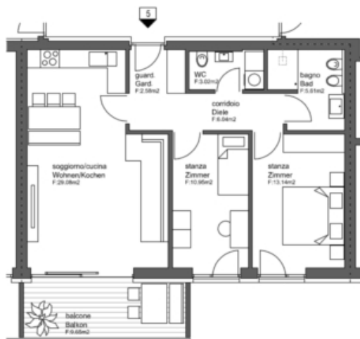
WOHNUNG 5 - APPARTAMENTO 5

FLÄCHE - SUPERFICIE: NETTO 70,42 m 2 BRUTTO 85,27 m 2 BALKON 9,65 m 2 BALCONE