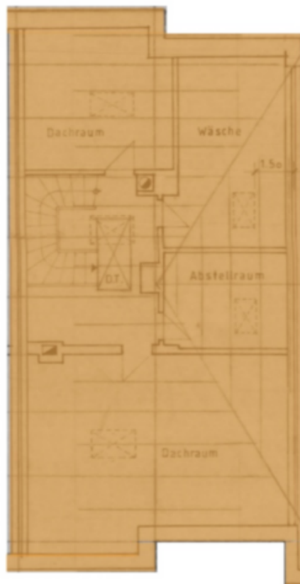
Dachgeschoss Piano sottotetto