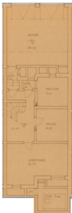
Kellergeschoss Piano interrato