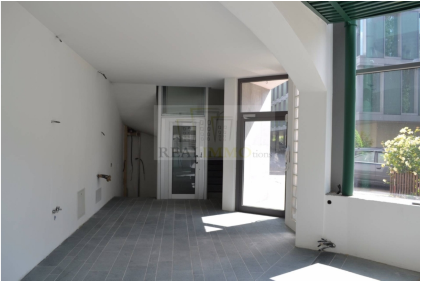
Piano interrato / Kellergeschoss