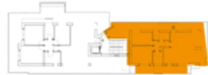
CANTINA PRIMO INTERRATO