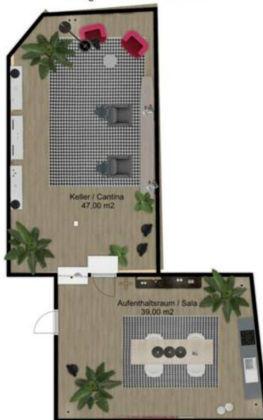
Untergeschoss - Piano Interrato