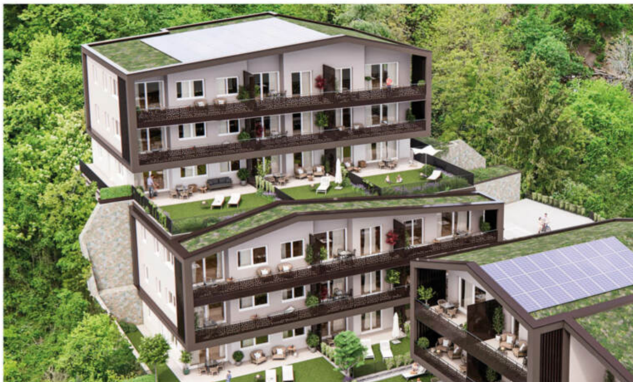
Wohnanlage Andrian - Am Berg complesso residenziale