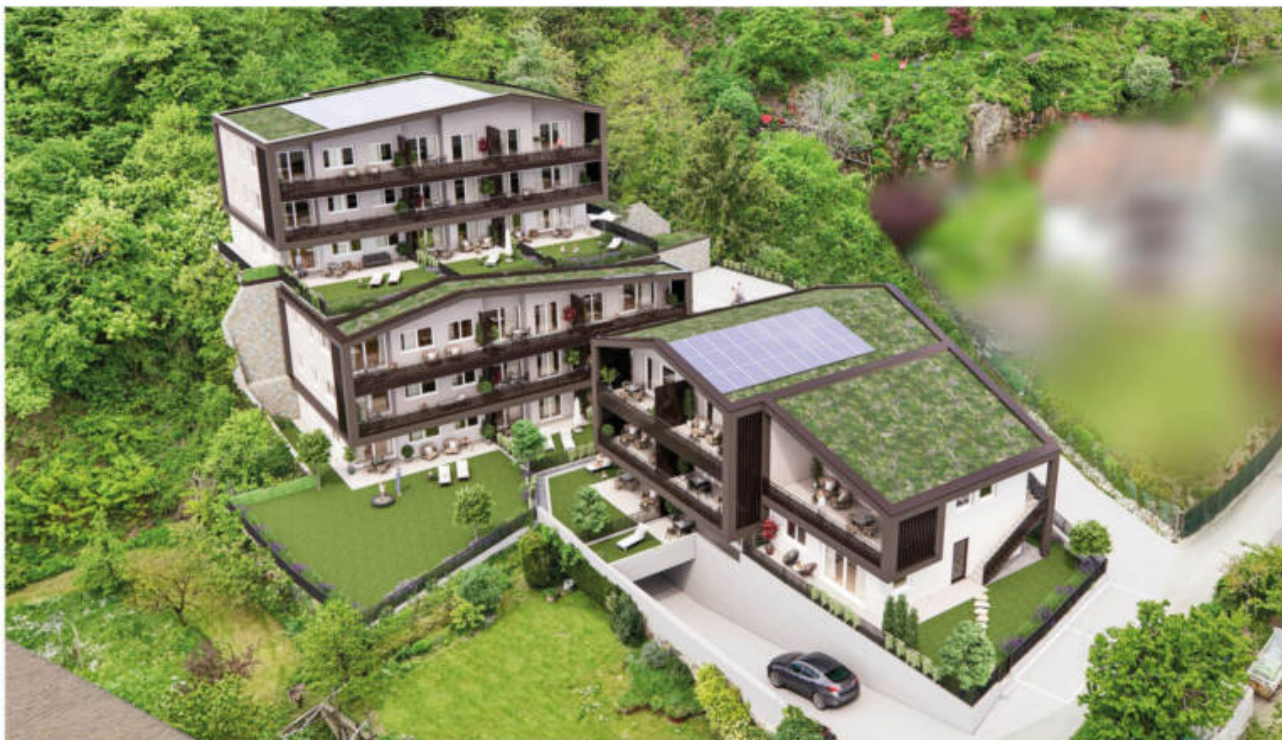
Wohnanlage Andrian - Am Berg complesso residenziale