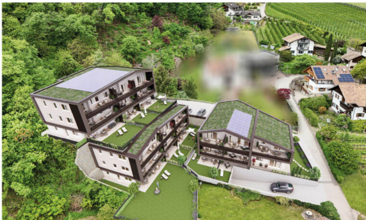
Wohnanlage Andrian - Am Berg complesso residenziale